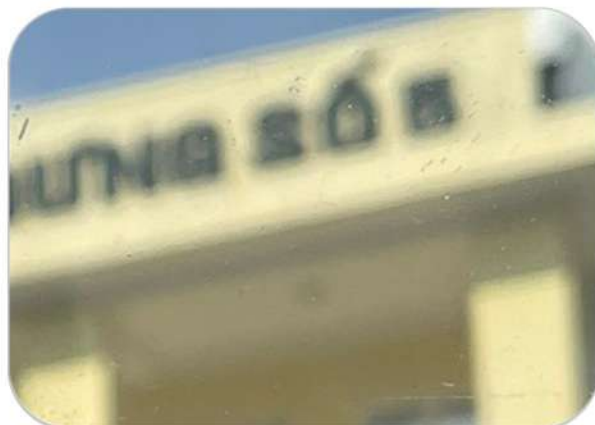
SS01 – CLEAR SOLID TRẮNG TRONG