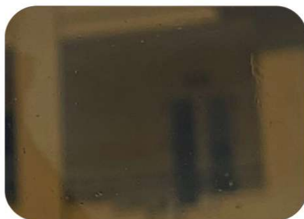
SS03 – BRONZE SOLID NÂU TRÀ