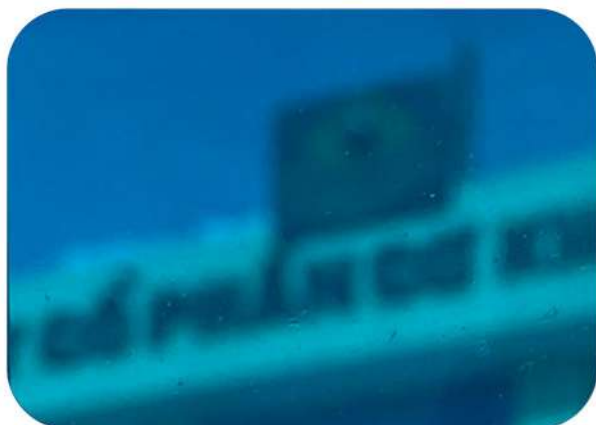
SS02 – BLUE SOLID XANH DƯƠNG