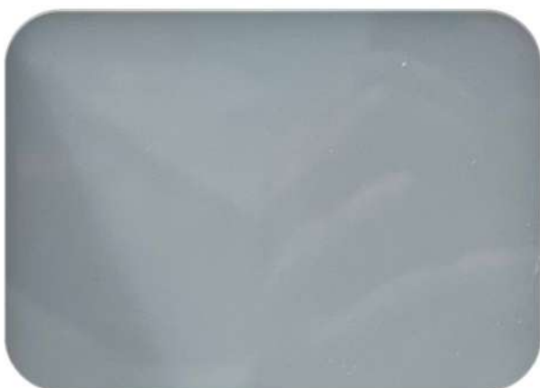
SS04 – WHITE SOLID TRẮNG SỮA